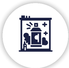
Cabinas de pintura