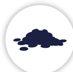
Aireación de granos