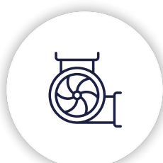
Sistemas de colección de polvo